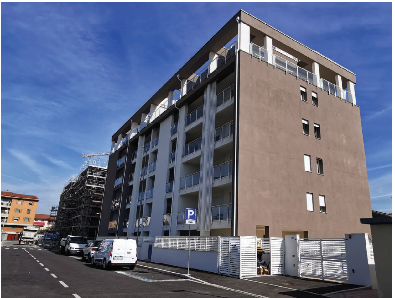
In this page, the via Valentini worksite in Prato.