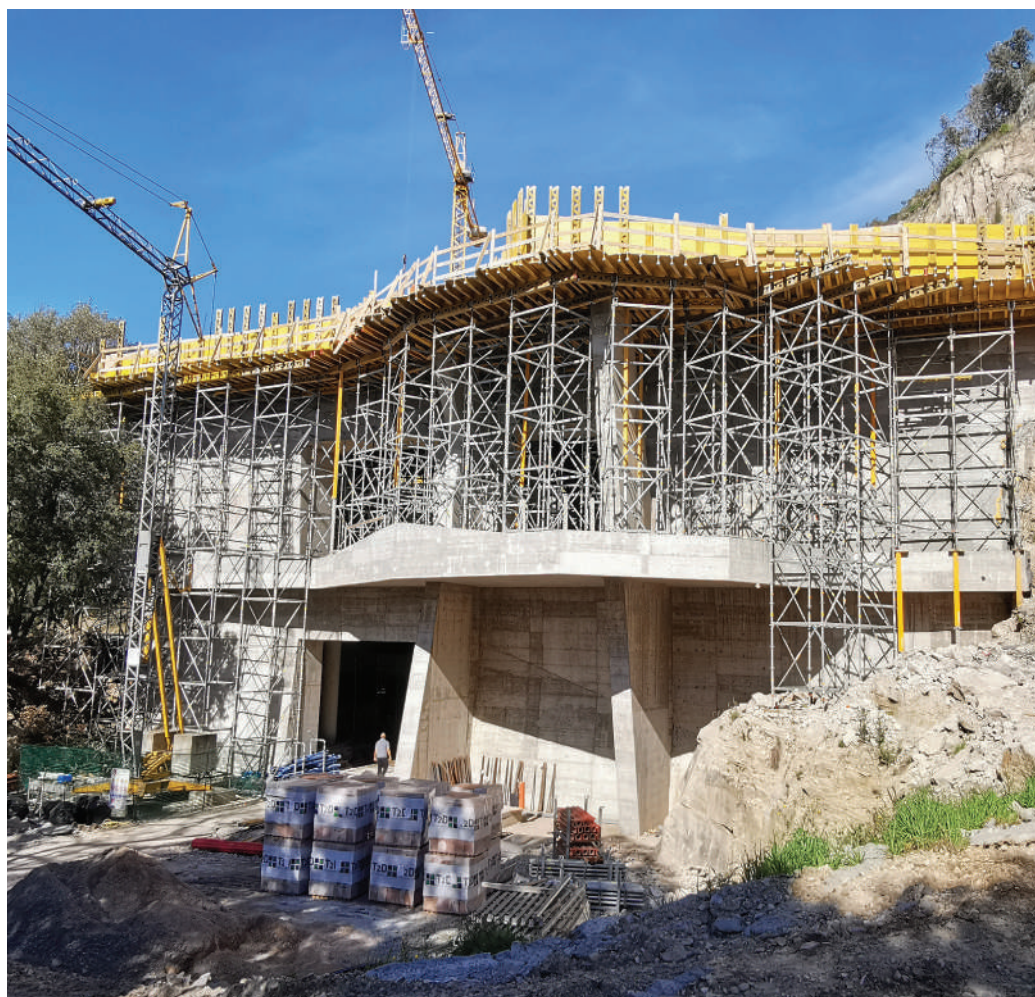
Here, the new winery built for Dievole in Castagneto Carducci (LI).