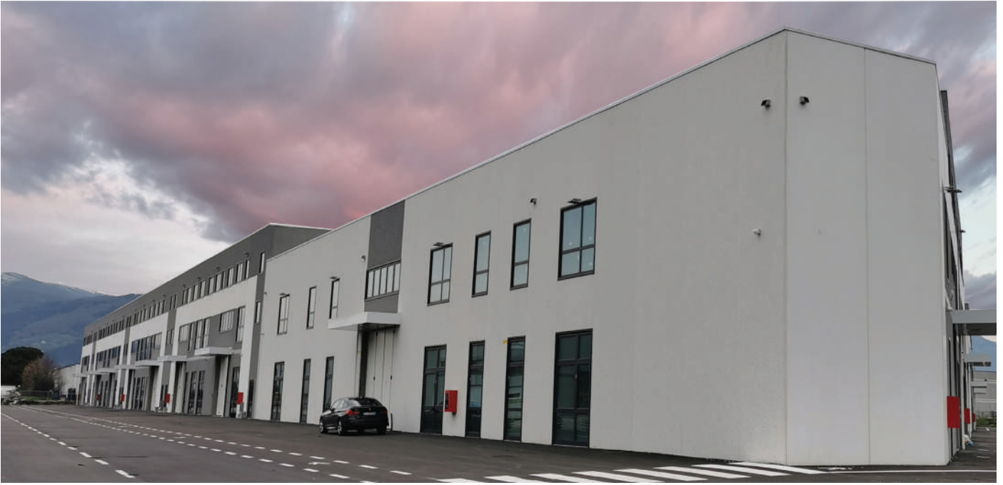
Il complesso industriale (UMI 81A e UMI 81B) di via Carpi - Prato Industrial complex in Prato, via Carpi (Prato, Italy)