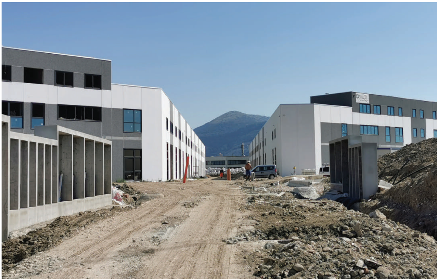
Il complesso industriale in costruzione in via Carpi - Prato Complex building site of via Carpi (Prato, Italy)