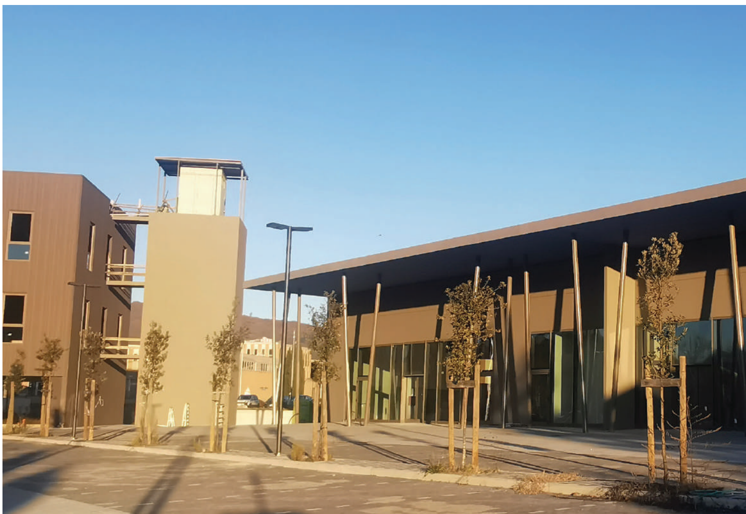
Below and on the next page: shopping center in Bibbiena (Arezzo), Italy.