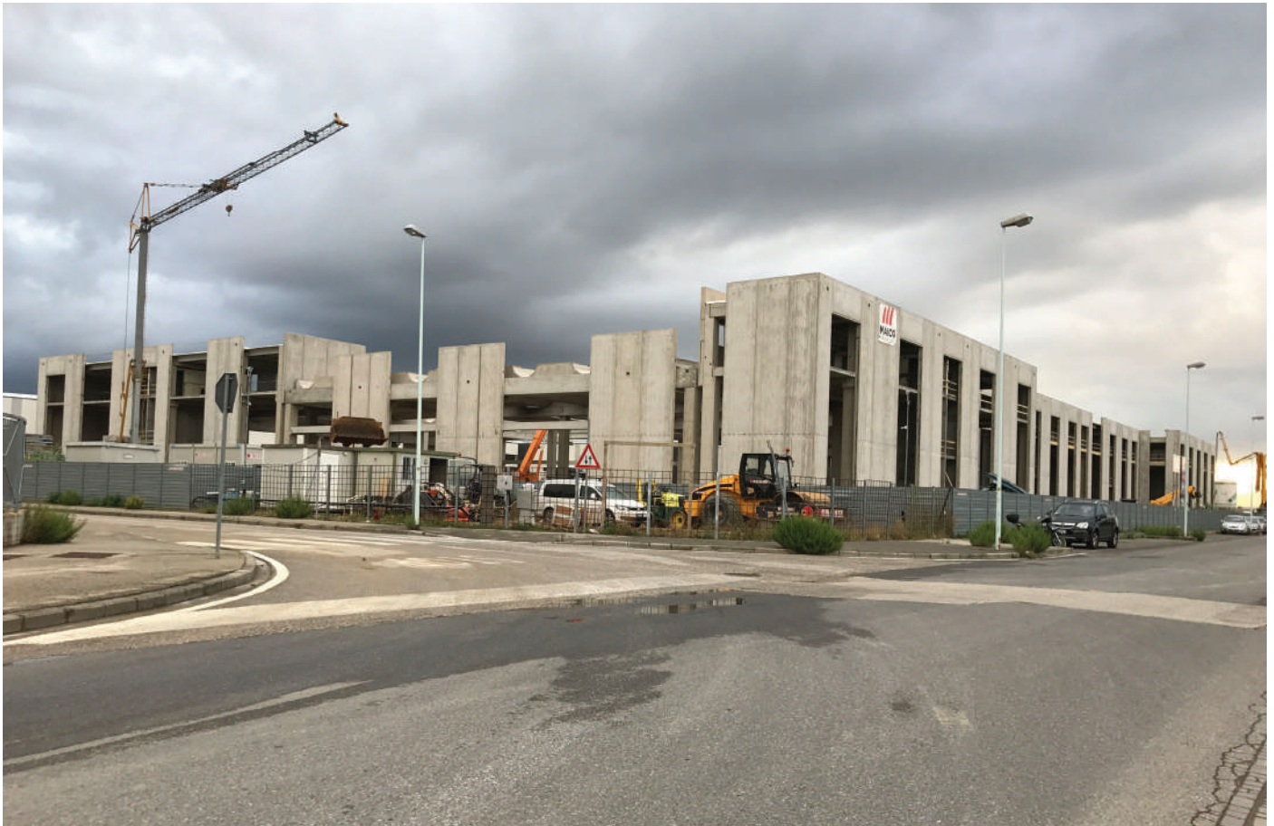
Da sinistra: a sede di Marina Militare a Signa durante il cantiere (sopra) e all'inaugurazione, la lottizzazione al Macrolotto (Prato) in fase di cantiere, lo stabilimento in località Confini.