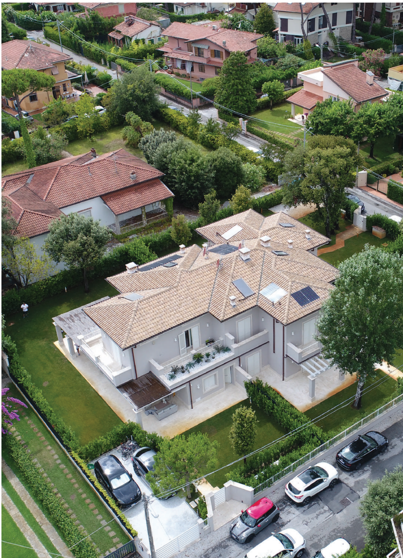
Foto aerea di villette per vacanze realizzate in Versilia Aerial photo of some holidays villas in Versilia (Lucca, Tuscany)