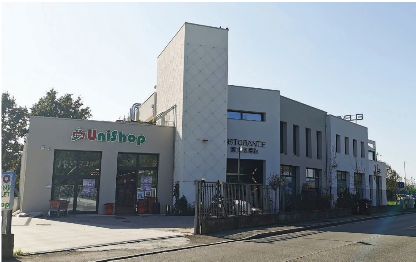
Sopra: l'immobile di Via Orione a Prato.