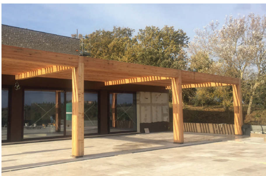
Qui, la nuova struttura realizzate per Dievole.