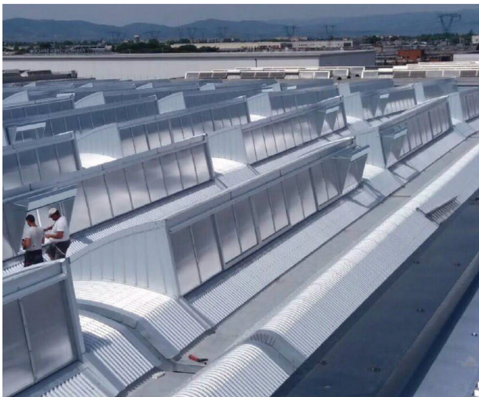
Operai al lavoro nel cantiere del complesso industriale del Macrolotto - Prato Work in progress in the Macrolotto industrial complex building site (Prato, Italy)

Campi di applicazione dell'azienda: Edilciacci application fields: