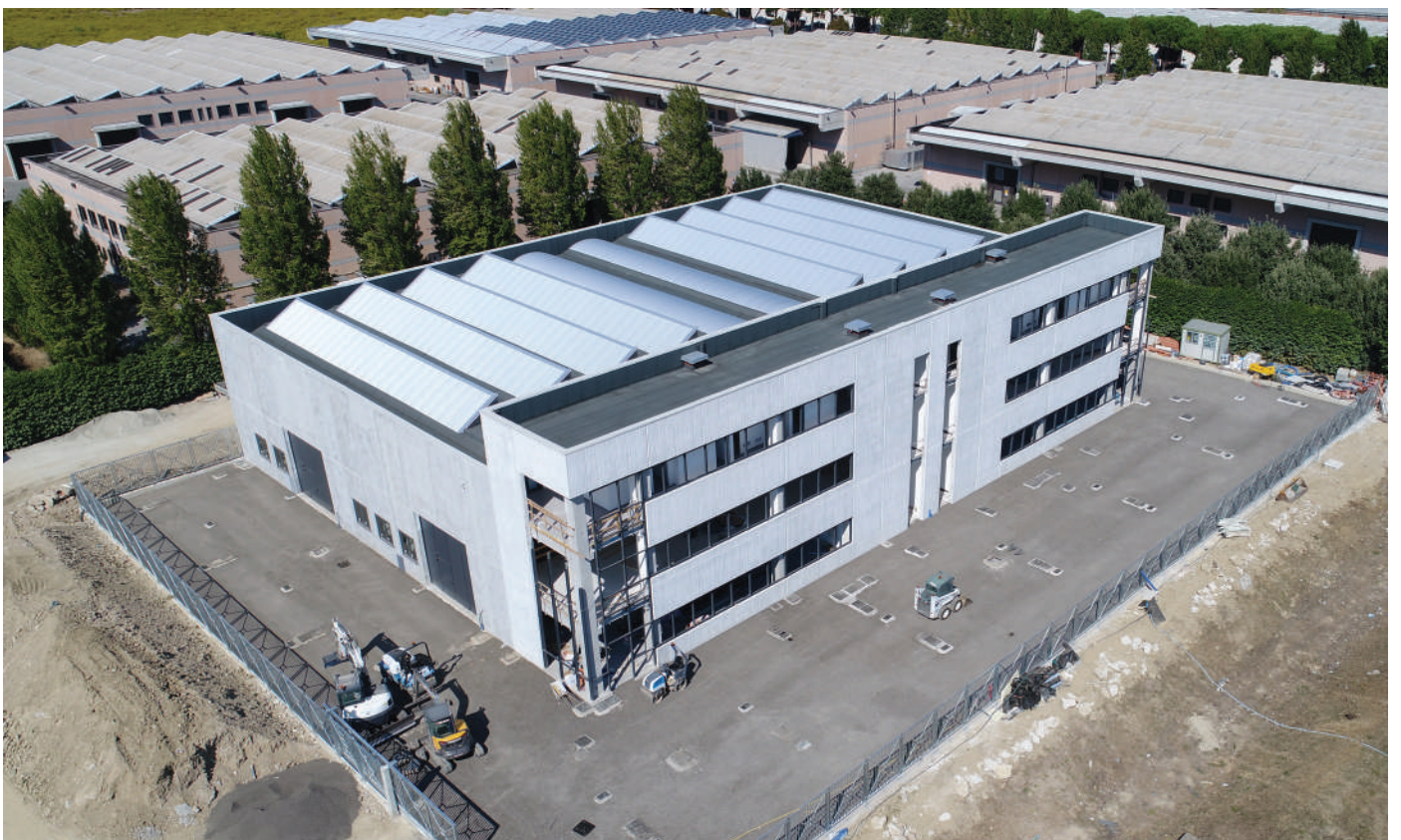
On the left images: Marina Militare in Signa (Florence, Italy) during the construction site and at the inauguration; Macrolotto industrial buildings during the construction site; industrial building in Campi Bisenzio (Firenze, Italy).