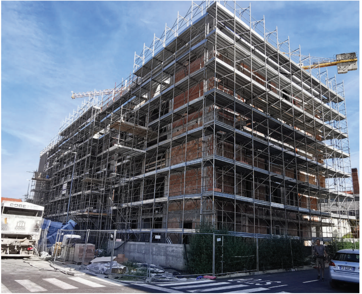
In questa pagina, il cantiere di via Valentini a Prato.