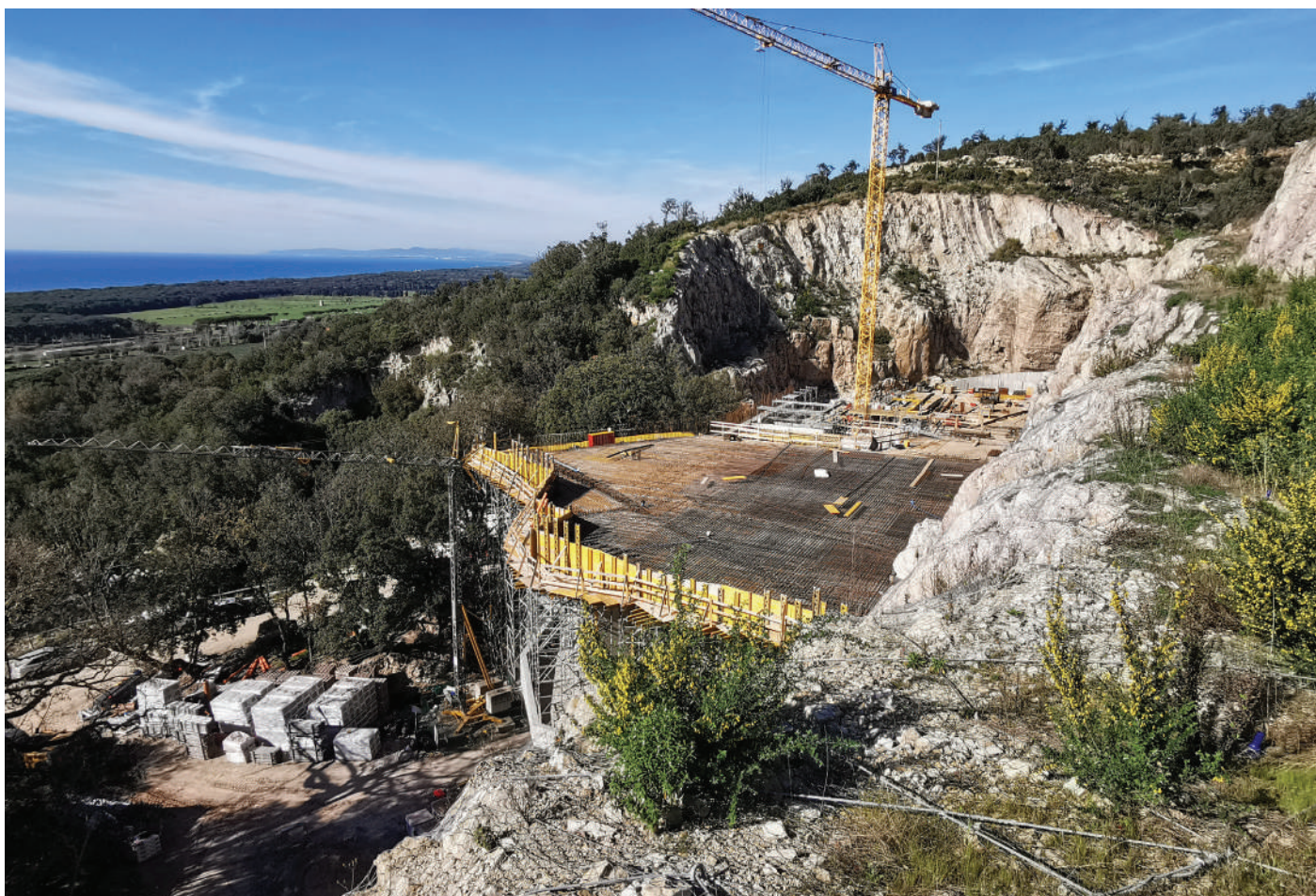
In queste pagine, la nuova struttura per Dievole nel territorio di Castagneto Carducci (LI)